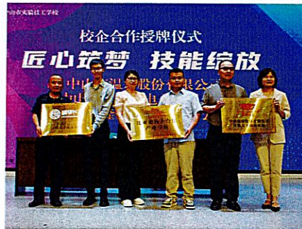
校企合作授牌仪式

学校秉持校企双元育人理念，构建“企进校、校融企”模式，与企业达成“人才共育、过程共管、成果共享、责任共担”的合作办学机制，打造集学术、教学、科研、创业孵化于一体的平台。目前，学校已与多家优质企业建立长期稳定合作，共建专业、合办产业学院，保障学生学业、实习与就业。同时，学校重视校企合作、产教融合，与企业共建“双师型”育人平台，通过“专业共建、课程共担、师资共训、基地共享”，实现“入学即入行、毕业即就业”的培养闭环，推动教学改革，培育高素质技术技能人才。