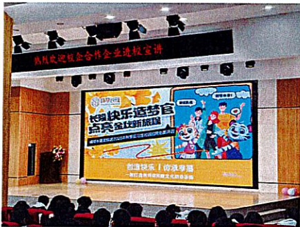
校企合作进校园宣讲