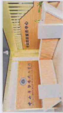
考证培训服务中心