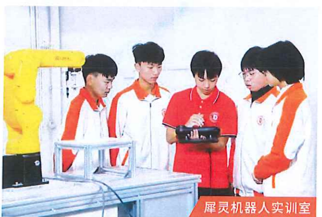
仿生机器人实训室