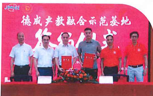
与中炬高新技术实业(集团)股份有限公司共建“德成产教融合示范基地”