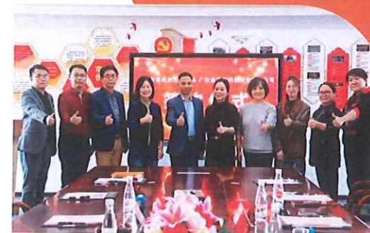
与广东省尊宠科技研究有限公司共同合作开办“宠物医疗与护理”专业