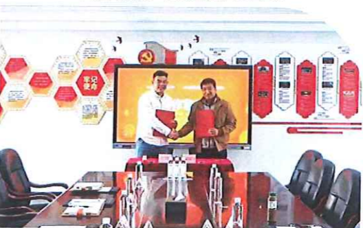
与犀灵机器人技术服务公司达成校企合作协议