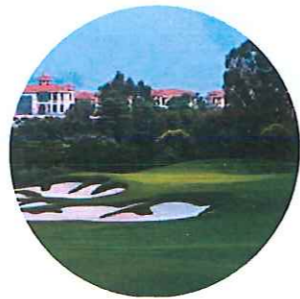
雅居乐长江高尔夫球会