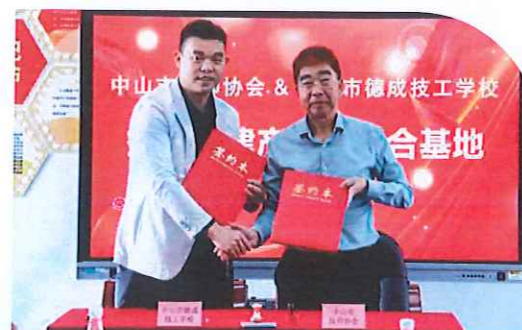
与中山市技师协会签约