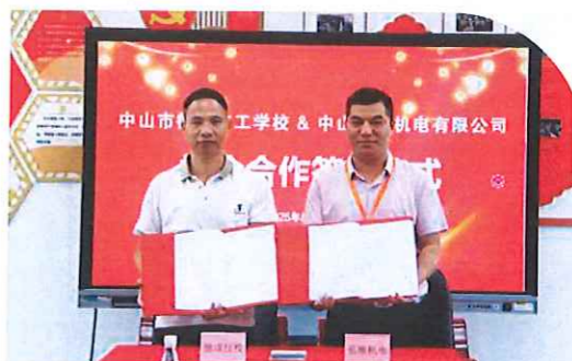
与中山长准机电有限公司签约