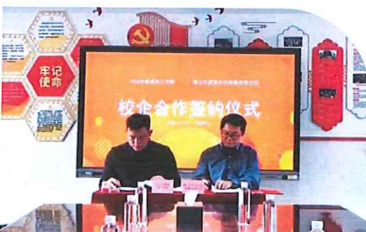
与匠厨文化达成校企合作协议