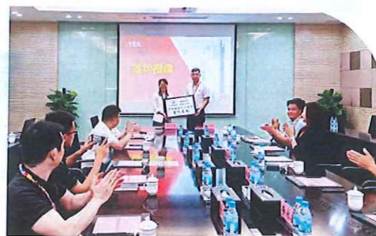
与中山TCL制冷设备有限公司签约