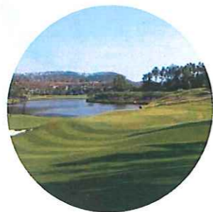
中山温泉高尔夫球会