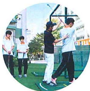
学校高尔夫训练场

中山温泉高尔夫球会建成于1984年,是中国第一个高尔夫球场,由霍英东先生出资建设,由此将高尔夫球运动带入中国、带入中山,大量企业家、运动员来到中山开启了高尔夫球事业。高尔夫的热浪继续滚烫,至1996年雅居乐集团看到高尔夫运动的巨大前景,斥资十亿元打造出国际锦标级、亚洲知名的长江高尔夫球会中山高尔夫产业已在全国知名,带动行业就业人员数万人!球童平均薪资可达8000~15000每月!